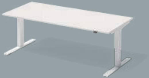
Varia Single - Einzelarbeitsplatz